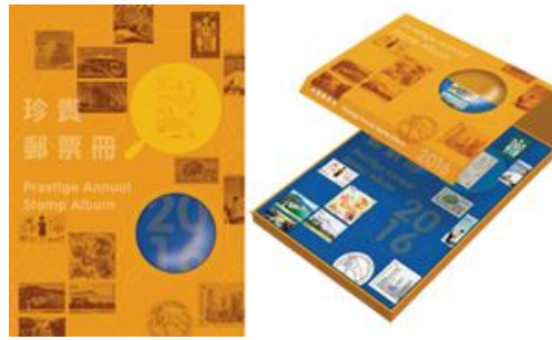
2016年珍貴郵票冊 (珍藏版) (港幣 $668)