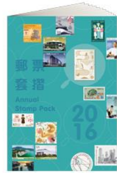
2016年郵票套摺 (港幣 $208)